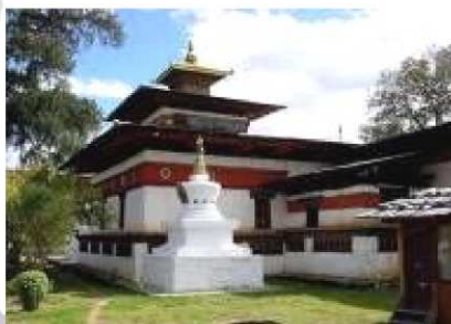
祈楚寺 (Kyichu, Lhakhang)